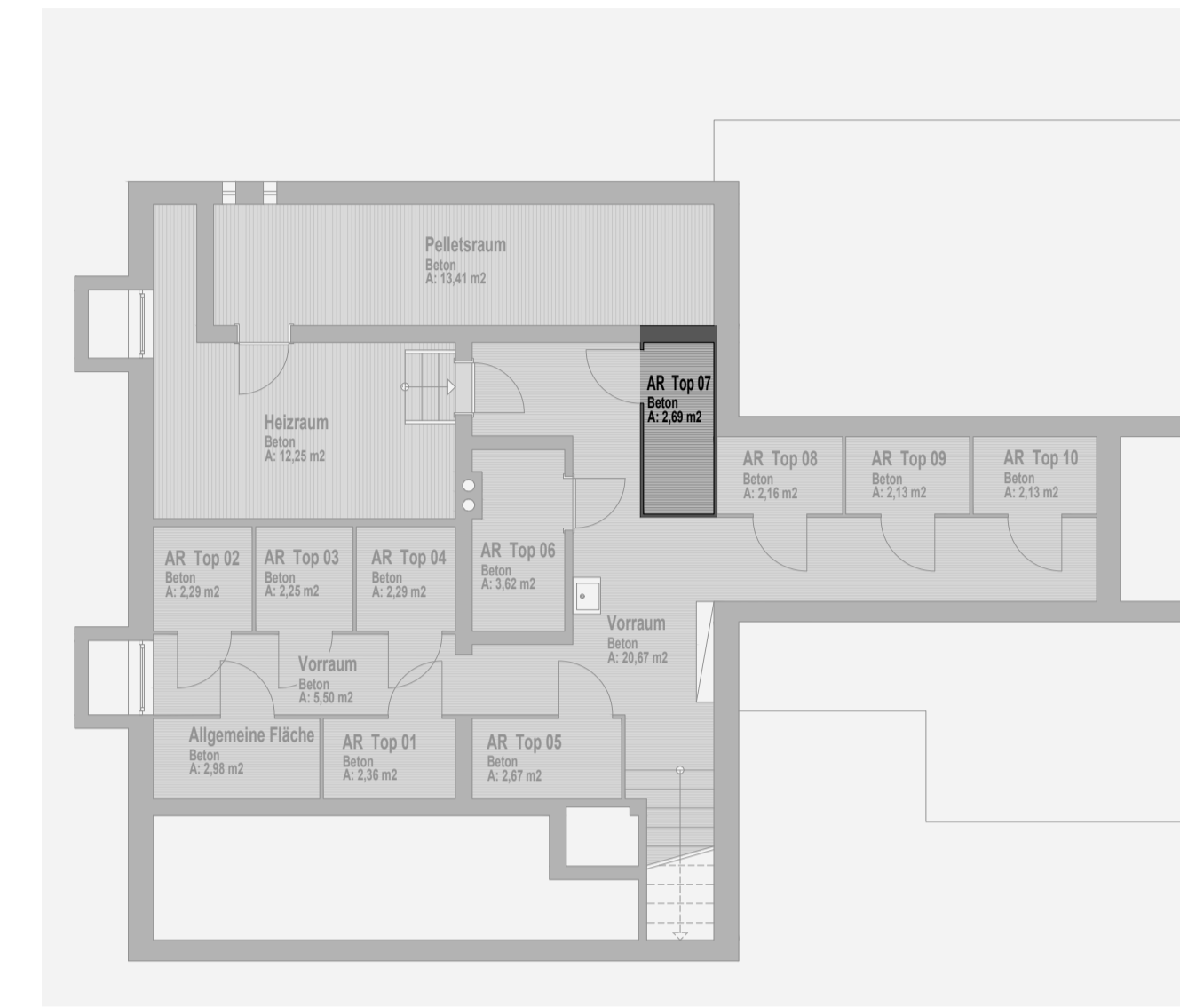
HAUS 54 KELLERGESCHOSS